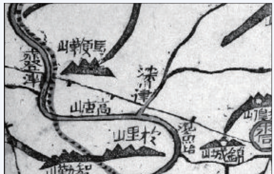
『대동여지도』 (16첩 3면) 적등진 일대

충청도 지방에서 불렀던 문헌상 이름 중 하나이다. 적등진은 옥천과 영동의 중간에 위치한 나루터로 영남지방과 호서지방을 잇는 길목이며 서울로 가는 교통 요충지이다. 『신증동국여지승람』(옥천)에는 “고을 남쪽 40리에 있는데 그 물 줄기가 셋”이라고 한다. 이 강변의 석벽이 붉은빛을 띠는 적벽으로 널리 알려졌으므로 ‘적등진’이라 부른다고 한다. 충청도 옥천·영동 일대에서 중요한 나루터였다고 하며, 자세한 유래는 알 수 없다.