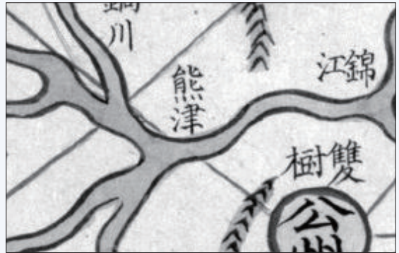
『대동방여전도』 (15첩 4면) 웅진 일대

고려·조선시대에 부르던 명칭의 하나이다. 공주지방을 웅천(熊川), 웅주(熊州) 등으로 부르게 된 것도 웅진(熊津)-고덕(高德)에서 비롯된다. 고덕(高德)은 곧 곱나루를 뜻하는데, 이 강가에 있었던 곱사당과 곱설화가 전해지고 있어서 고조선을 비롯한 북방민족의 곱 토토펙사상이 민족의 이동을 나타내는 것임을 전해주고 있다. 조선시대까지 나라에서 명산대천에 제사지내던 곳이었던 웅진연소(熊津衍所)가 있었다.