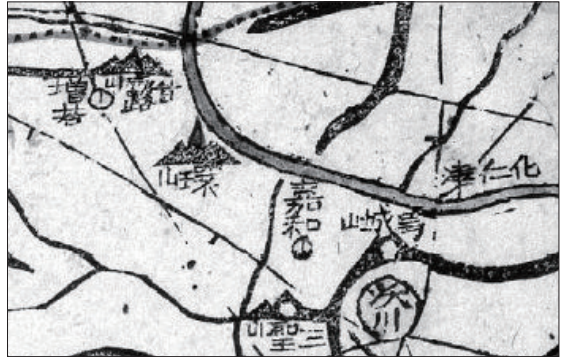
『대동여지도』(16첩 4면) 화인진 일대

으로 화인진이 된다”고 하였다. 그러나 그 명칭의 내력에 대하여는 자세히 알 수 없다.