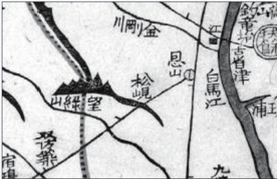
『대동여지도』 (16첩 5면) 백마강 일대

백제어에서 ‘백(白)’의 새김이 ‘畚’(sarp)으로서 백강이 사비강을 뜻하는 것으로 보이므로 백마강=백촌강의 마(馬)=촌(村)을 말(마을)로 풀이하면 사비 마을강을 뜻하는 것으로 해석하기도 한다. 고란사 아래 나루터에서 보면 바위섬이 보이는데 이 바위가 조룡대이다.