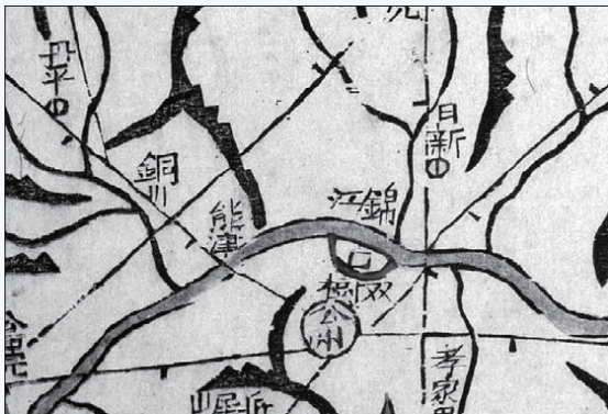
『대동여지도』 (15척 4면) 금강 일대

‘금강’은 공주의 북쪽을 지칭하는 명칭으로 백제의 고도(古都) 공주의 옛이름 고모노루>굽나루>곰나루>웅진(熊津)에서 비롯된 것으로 보고 있다. ‘곰(高母)’은 ‘곰’ 계열어의 하나로서 방위상으로는 후(後, 뒤), 북(北)을 뜻하면서 큼(大, 많음(多), 신성함 등을 나타내는 옛말이다. 이 ‘곰’에서 큰강>굽강>곰강>금강(錦江)이 된 것으로 보며, 금강의 ‘금(錦)’이 곧 곰의 사음(寫音) 표기일 것으로 해석하고 있다. 금강은 백제가 한성에서 웅진과 사비로 천도하게 된 중요한 지리적 요인의 하나로서 백제 후기의 역사와 매우 긴밀한 강이다.