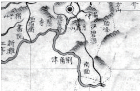
『팔도군현지도』(문의) 형각진 일대

충청도 지방에서 불렀던 명칭의 하나이다. 『신증동국여지승람』(옥천)에는 “문의현에서 형각진이 된다”고 하였고, 『대동여지도』에는 그 부근에 형강(荊江)이 표기되어 있으므로 같은 이름의 다른 표기로 볼 수 있다. ‘형(荊)’은 곧 ‘가시’로서 거칠거나 크다는 옛말과 관계되므로 큰 강을 뜻하는 이름으로 보이며, 자세한 유래는 알 수 없다.