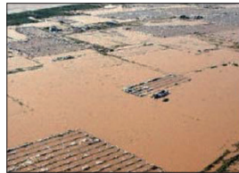
홍수 피해 모습 <연평균 호우 일수 평년대비 최근 10년 동안 증가>

지구촌 곳곳에서 이상기후에 따른 환경재해 피해가 해마다 증가하고 있다. 특히 국지적인 게릴라성 집중호우로 인한 피해는 예측하기가 힘들뿐만 아니라 그 피해는 상상을 초월한다. 우리나라도 예외가 아니다. 한반도는 6~8월에 연간 강수의 대부분이 집중되는 몬순기후의 특성을 가지고 있다. 따라서 여름철 집중강우로