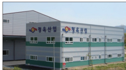
청옥산업 임실 사옥 전경. 최근에 청주 제1공장에 이어 전라남도 임실에 제2공장을 건설하였다.

지속가능한 수자원의 개발과 보존의 조화를 항상 염두 하여 미래 가치 중심에 기반한 의미 있는 기술 개발에 힘써야 한다. 치열한 경쟁을 피할 수 없는 시대이지만 뚜렷한 목표 의식을 갖고 기술 개발에 힘쓰면 물 관리 시스템 분야에서 인간과 자연이 상생하는 장인 기업을 이룰 수 있다."라고 피력했다.