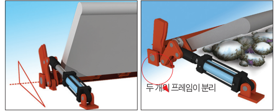
구동부품들이 평시에는 안정적인 삼각구조로 되어있다가, 이물질 등에 의해 수문이 걸리게 되더라도 두 개의 프레임이 서로 분리되어 실린더나 문비의 손상을 막는다.

'청옥가동보'는 롤러가 가이드 프레임의 안내면을 구름운 동하면서 기립, 도복하는 방식으로 두 개의 프레임이 분리될 수 있게끔 제작하여 나무나 자갈, 돌 등 이물질이 걸려도 수문이나 실린더가 손상될 염려가 없다.