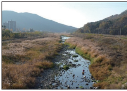
갈수기의 하천 모습. 가뭄피해와 하천오염이 반복된다.

해외 선진국뿐만 아니라 국내에서 차세대 녹색기술(Green Technology)에 관심이 고조되는 것도 이러한 환경적 위협으로부터 인간의 생명과 재산을 지키고자 함일 것이다. 같은 맥락에서 댐이나 저수지, 하천 등 인간이 필요한 물이 환경적 변수에 의해 위험요소로 다가오는 것을 막기 위해서는 체계화·첨단화된 물 관리 시스템이 필요하다. 최근 이러한 '물 관리